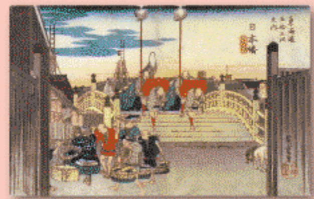
歌川広重<保永堂版 日本橋「朝之景」>

特別展 歌川広重 二つの東海道五拾三次 保永堂版と丸清版 7.14 sat - 9.17 mon 料金 特別展観覧料 ゴッホやモネなどの画家に影響を与え、世界的に著名な浮世絵師である歌川広重(1797-1858)による、版が異なる二つの「東海道五拾三次」を展覧します。