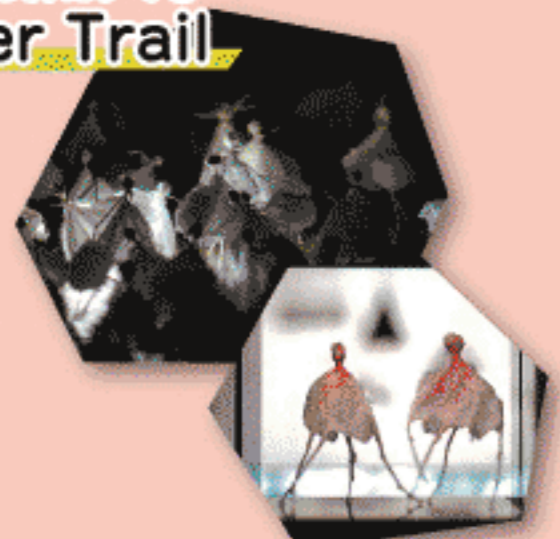
艾沢詳子<My friend> 2017

艾沢詳子 × 千歳科学技術大学 ライトアート工房 Paper Trail 7.27 fri - 8.19 sun 料金 常設展観覧料 紙とロウを素材に制作活動を展開する美術家・艾沢詳子と、千歳科学技術大学ライトアート工房による光技術の空間展示により、博物館常設展示室を大変容させます。