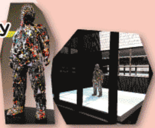
大森記詩<Training Day - Far East Suit> 2017

中庭展示 Vol.11 大森記詩 Training Day 5.5 sat - 9.17 mon 料金 特別展観覧料 プラスチック・モデルのパーツの組み合わせによる彫刻表現により注目を集める美術家・大森記詩(1990-)の作品を展示します。